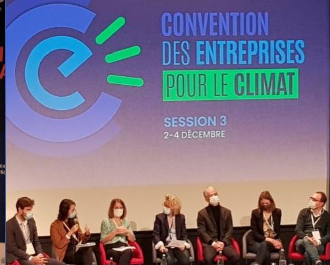
TABLE RONDE : "FINANCER SA REDIRECTION"

Deuxième temps : échanges avec Barbara Pompili , ministre de la Transition Écologique, accompagnée d'une délégation qui a suivi le troisième temps de la journée : "Sustain' Pursuit" , serious game développé par les équipes d'Audencia.